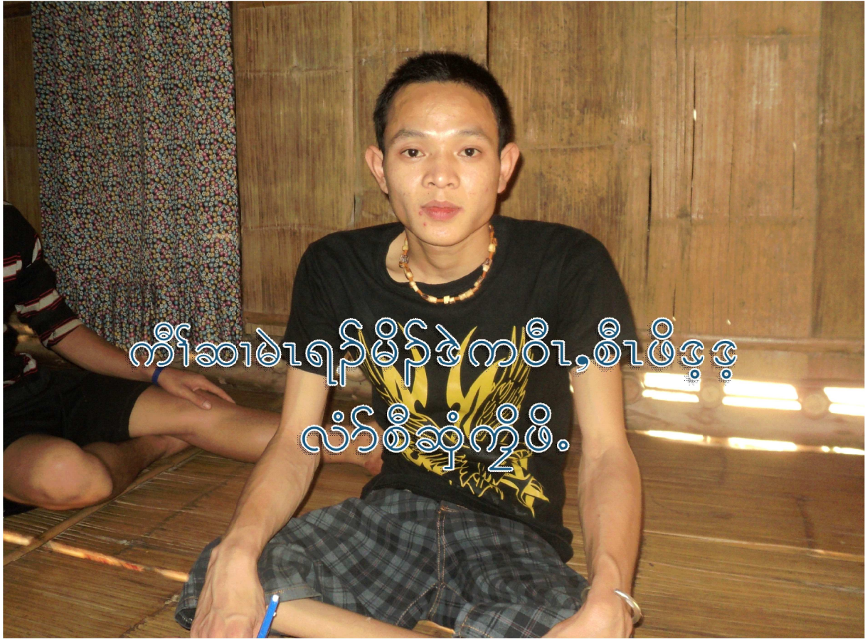
ကိုဆာမရည်မိန်ဒဲကဝီ၊စီဖိဒုဒု လံာ်စီဆုံကွံဖိ.