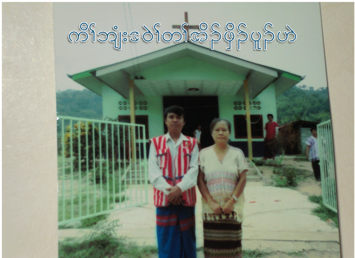
ကိုးဘျားဒဲင်တမ်အိန်ဖိုင်ပူဉ်ဟဲ