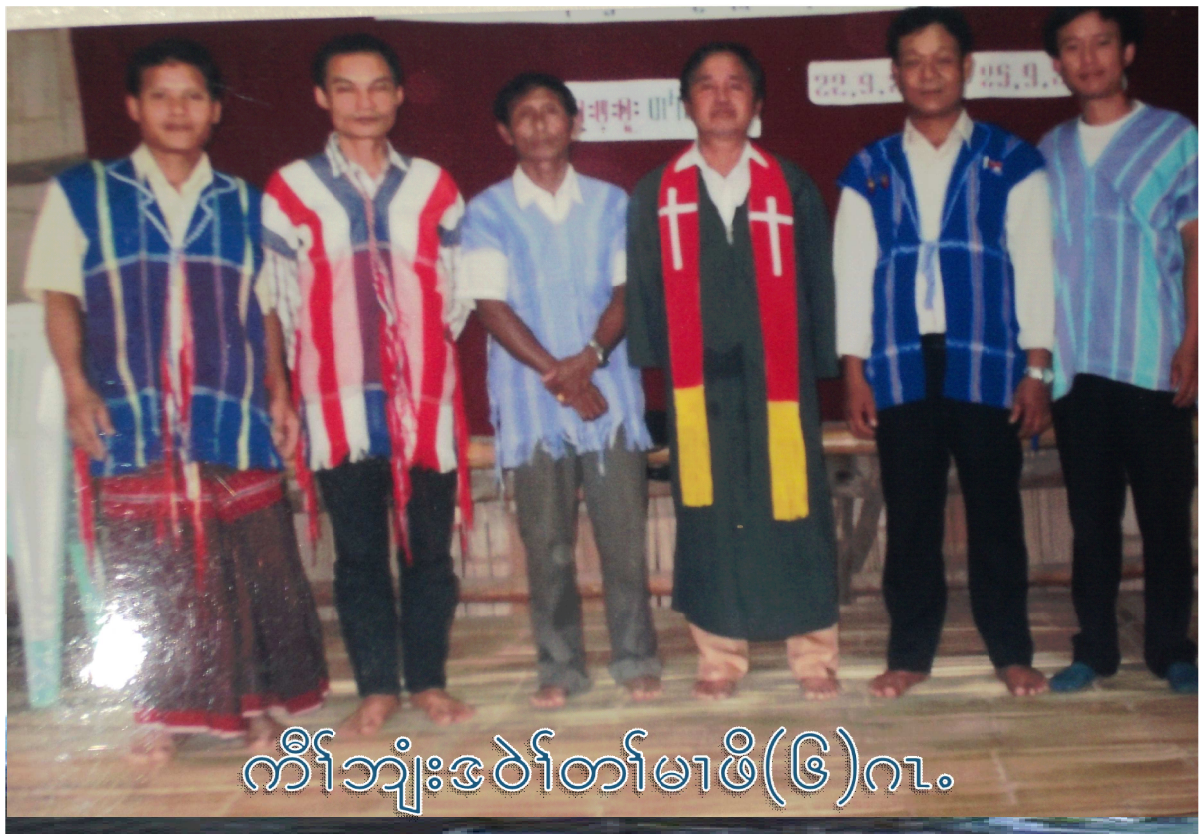
ကိုးဘျားဒဲင်တမ်မာဖိ(၆)ဂါ့.